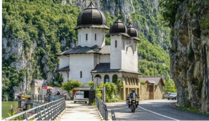
Auf dem Weg vom Siebenbürgischen Becken nach Süden: Imposant erheben sich die Südkarpaten vor uns – nahe Cârța (l.). Wir folgen den Spuren der Donau vorbei am 1523 erbauten Kloster Mraconia (o.). In den weniger touristischen Teilen Rumäniens sind große Motorräder selbst heute noch selten – bei Țifra (u.). Auch kulinarisch begeben wir uns auf Entdeckungsreise.