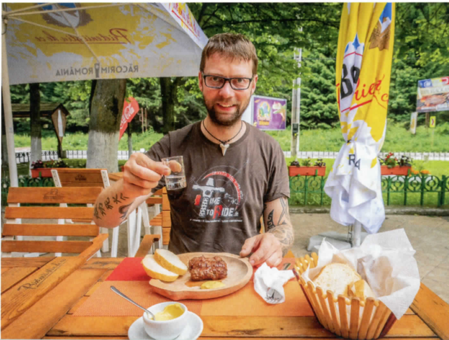
Das Siebenbürgische Becken, besser bekannt als Transsilvanien, führt uns in das Herz Rumäniens