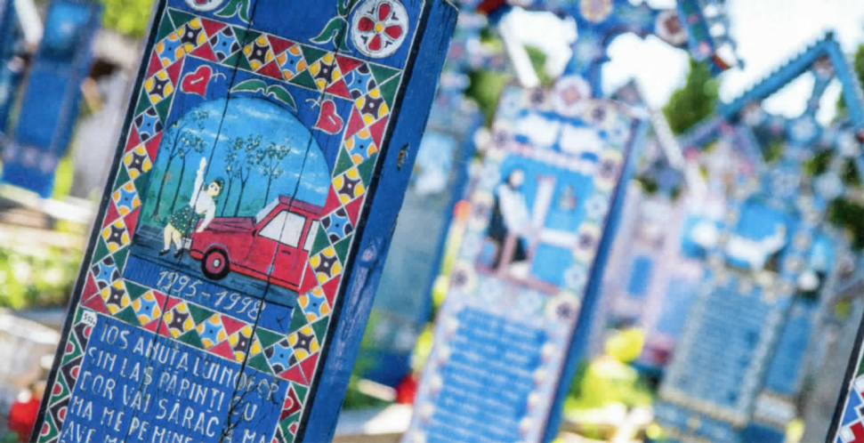
Spektakuläres Nachtlager: Zeltplatz nahe der Passhöhe der Transfăgărășan (r.). Farbenfroh: Auf dem »Fröhlichen Friedhof« von Săpânța erzählen die Grabsteine vom Leben der Verstorbenen (o.). Die Transalpina führt auf über 2100 Metern in die raue Bergregion der Südkarpaten (u.). Touristen-Nepp oder Must-see? Am vermeintlichen Dracula-Schloss Bran scheiden sich die Geister (g. u.).